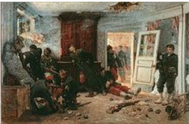
« Les Dernières Cartouches » d'Alphonse de Neuville (1873)