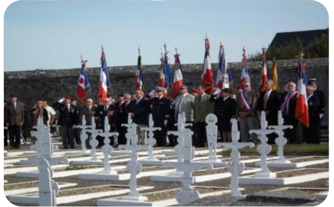
Hommage aux Marsouins de la Division Bleue, au cimetière de Notre-Dame de Granville, le 1 er septembre

A l'issue de cette émouvante cérémonie, le maire de de Granville, a aimablement invité l'ensemble des participants, à un cocktail offert par la municipalité. C'est donc dans