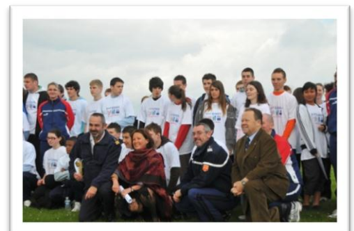
Le Rallye-Citoyen a réuni à l'Ecole des Fourriers de Querqueville plus de 120 participants du Calvados, de la Manche et de l'Orne.

A ce titre, il peut informer et sensibiliser les administrés de la possibilité offerte à chaque citoyen de prendre part à des activités de défense dans le cadre des préparations militaires, du volontariat et de la réserve militaire (opérationnelle et citoyenne).